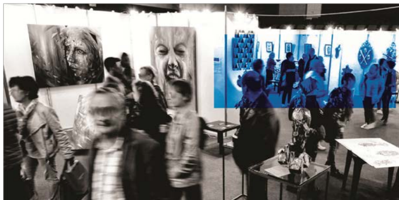
Mehsos @ Stand Filleul Galerie

En 2017, c'est le record du plus grand salon artistique du genre, battu avec ses 341 artistes exposants sous le contrôle d'un huissier de justice. Sur une surface de +ou- 8500m 2 .