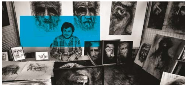
De Cesare Jonathan - Photographe © Coco Nosaure

Nous estimons que le nombre de visiteurs cette année, dépassera très largement les 10.000 personnes.