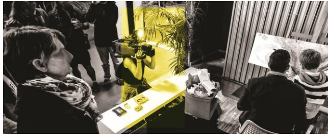
David Terrazano @ Filleul Galerie

Comme l'année passée la Filleul Galerie présentera 13 de ses artistes sur 3 espaces : l'atrium, le couloir et la salle Rubis pour vous accueillir sur 450m2 .