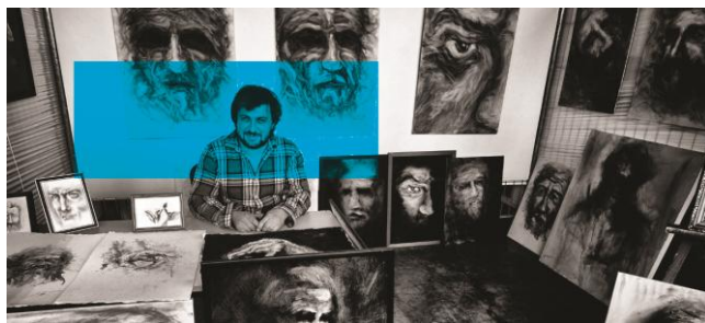
De Cesare Jonathan - Photographe © Coco Nosaure

Nous estimons que le nombre de visiteurs cette année, dépassera très largement les 10.000 personnes.